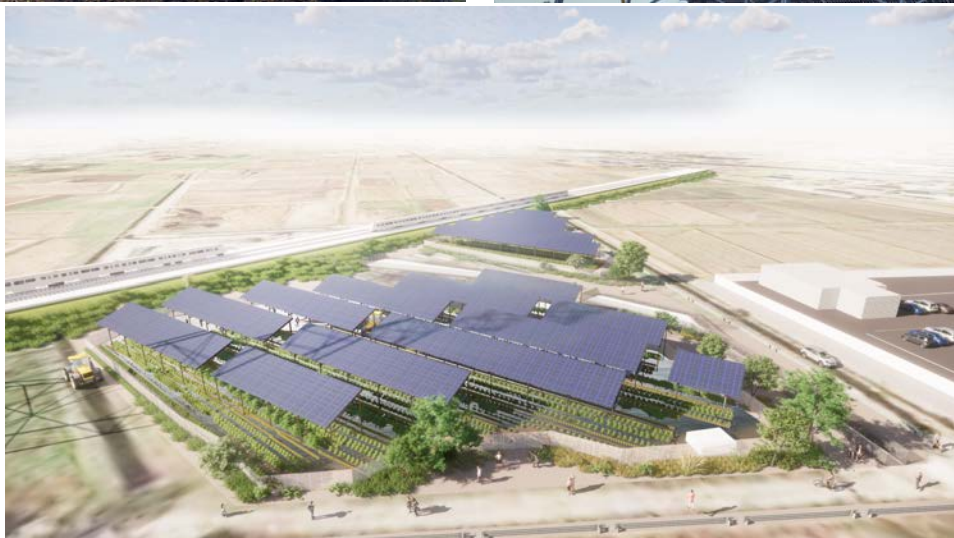
リエネソーラーファーム東松山 太陽光発電所の全景（イメージ）